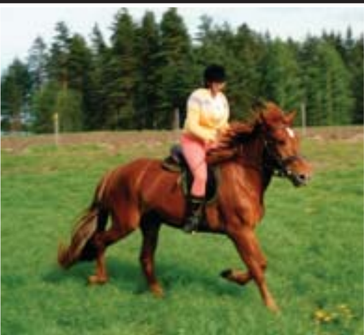
Anitan ja Tupla-Vissin ensimmäinen laukka ratsain. Tyylin kruunaa komea arnejansatula.