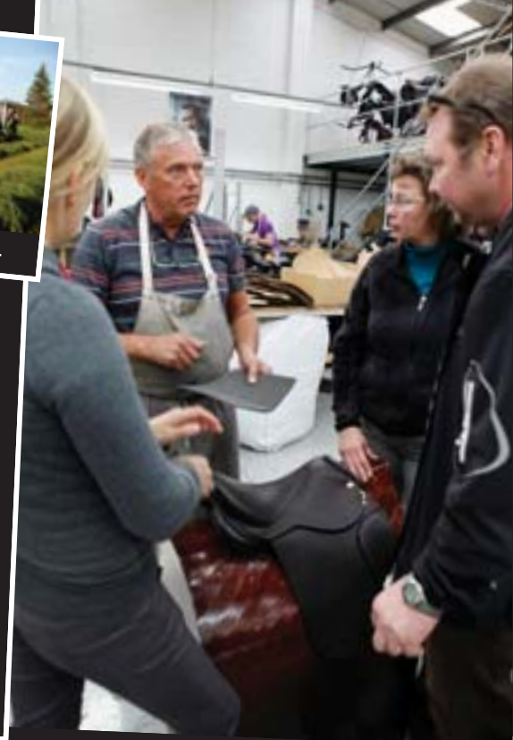
Satulatietoutta kuuntelemissa Black Countryn tehtaalla Englannissa.