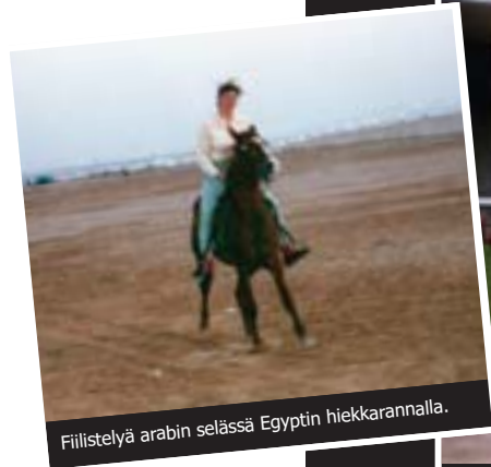
Fiillistelyä arabin selässä Egyptin hiekkarannalla.