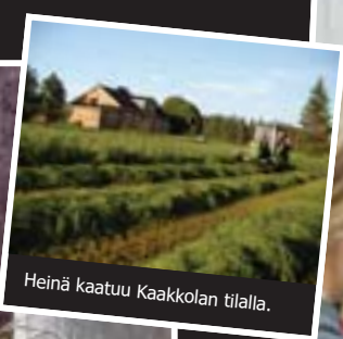
Heinä kaatuu Kaakkolan tilalla.