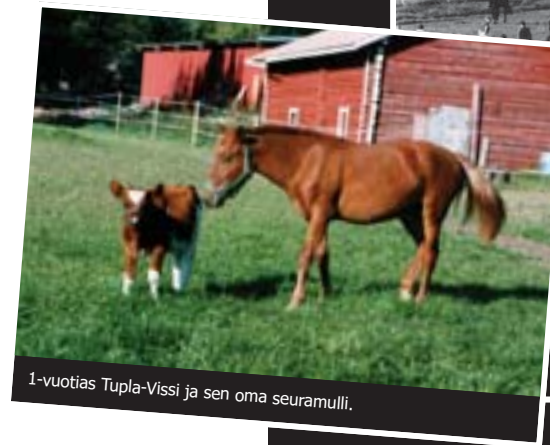
1-vuotias Tupla-Vissi ja sen oma seuramullu.